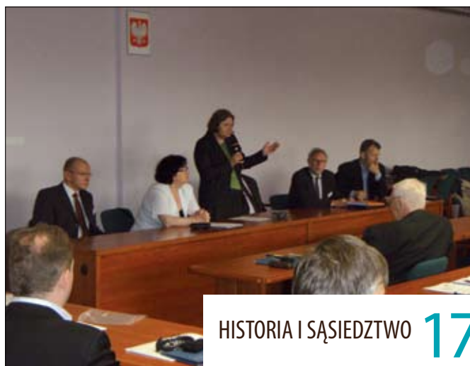
HISTORIA I SĄSIEDZTWO

Nowy rok akademicki po raz 65. zainaugurowany został na Uniwersytecie Łódzkim 8 października. Ta jedna z najważniejszych uroczystości w życiu uczelni tym razem odbyła się w auli czerwonej gmachu Wydziału Prawa i Administracji – wizytówce naszej Almae Materis. Zebrali się w niej przedstawiciele władz państwowych, województwa, miasta, uczelni oraz studenci.